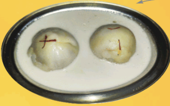
दुध लाडु (२ नग) Dudh Ladoo (2pc) 126

It is ladoo made up of steamed rice floor stuffed with coconut and gulkand. These steam ladoo are cooked in jaggry water and thickened with coconut milk