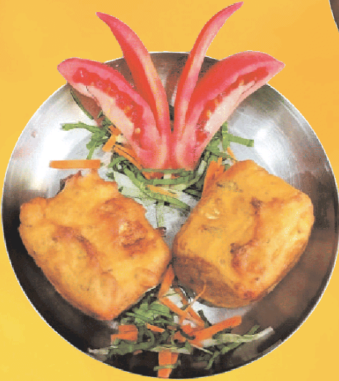
ठेचा पाव (२ नग) Thecha Paav (2 PC)