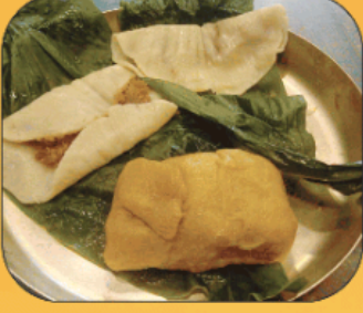
पुरणाचे दिंड (१ नग) Purnache Dind (1 pc)